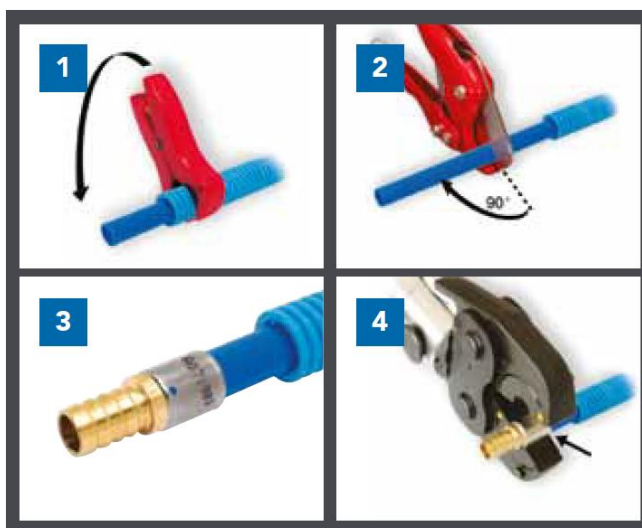
Profil du raccord : CO

Les raccords à sertir PexPress sont utilisables avec les tubes PER COMAP (et ouvrent le droit à une garantie 10 ans) et également avec les tubes PER certifiés ATEC respectant les dimensions suivantes :